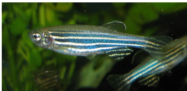
Fig. 1: nématode

Cette étude du génome, les chercheurs l'effectuent toujours en premier lieu chez les animaux, afin de déterminer les fondements et de comprendre les mécanismes. Les expériences sur les animaux contribuent en général de façon importante à transposer les principales découvertes de la recherche fondamentale dans la recherche appliquée. Elles jouent un rôle clé dans la découverte des processus de la vie ainsi que dans l'étude des maladies et le développement de nouveaux procédés médicaux pour l'homme comme pour les animaux: les expériences sur les animaux ont ainsi joué un rôle direct dans 75 des 98 travaux de recherche récompensés par un prix Nobel de médecine et de physiologie.